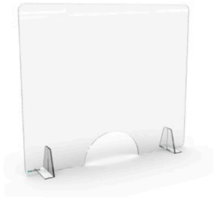
Modelo para atendimento