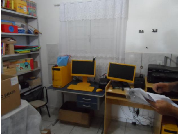
Foto 3 – Escola 1 passos, a única sala de Recursos multifuncionais montada e disponível para uso dos alunos dentre as escolas analisadas.