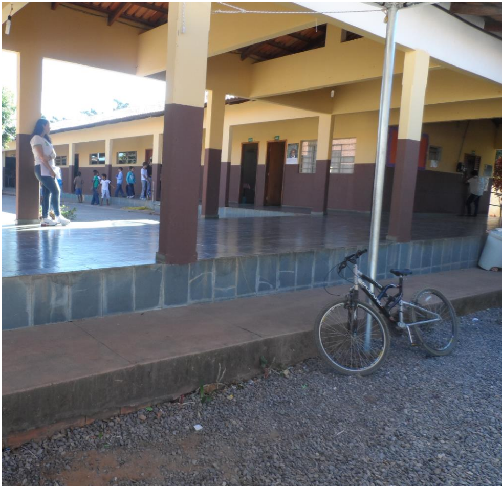
Foto 2 – Escola Municipal Maria Leite, o desnível impossibilita o acesso de alunos com mobilidade reduzida aos outros ambientes da escola.

Foto 1 – Escola Municipal Dr. Joaquim, a inexistência de rampas e guarda corpo pode causar danos as crianças.