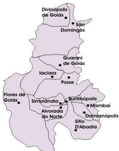
Imagem 1: Vão do Paranã

Alvorada do Norte Buritinópolis Damianópolis Divinópolis de Goiás Flores de Goiás Guarani de Goiás Iaciara Mambaí Posse São Domingos Simolândia Sítio D'Abadia